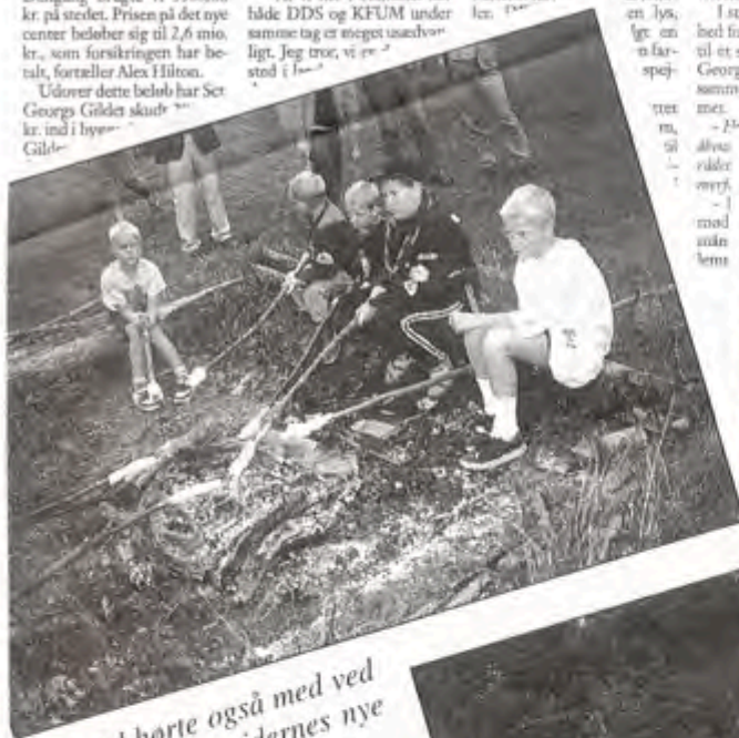
Snobrød hørte også med ved indvielsen af spejdernes nye hus i Engedal.

måder er en forbedring i forhold til det gamle.