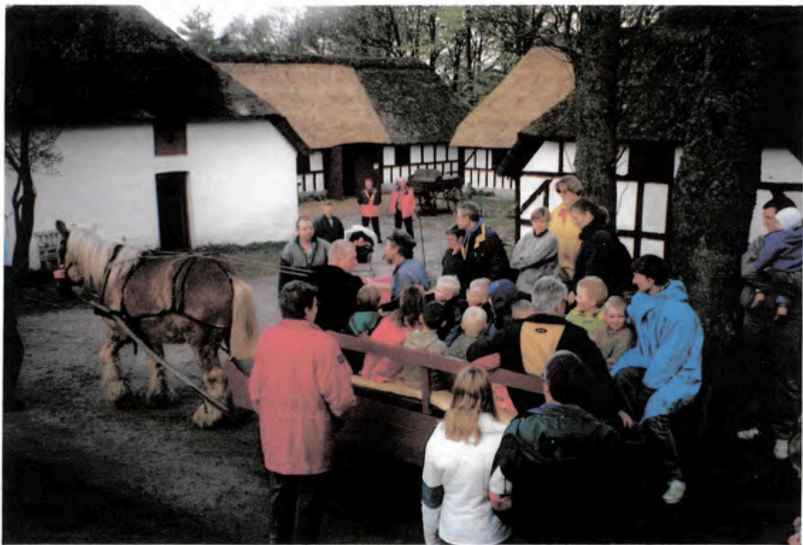
Fra udflugten til Høgdal