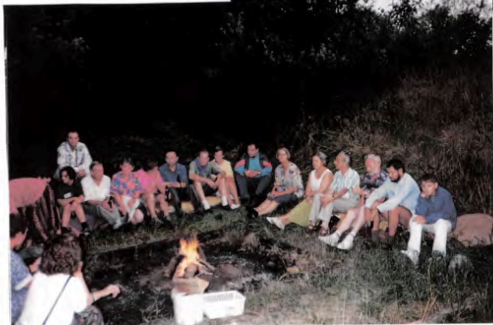
Friluftsgildehal i Engedalen