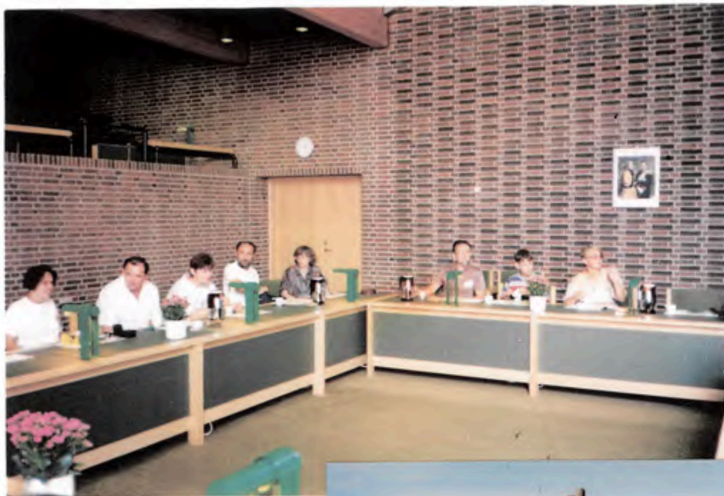
Vi bliver modtaget på rådhuset