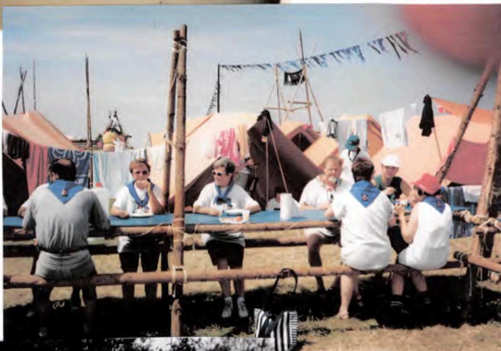
Vi tager en udflugt til Blå Sommer