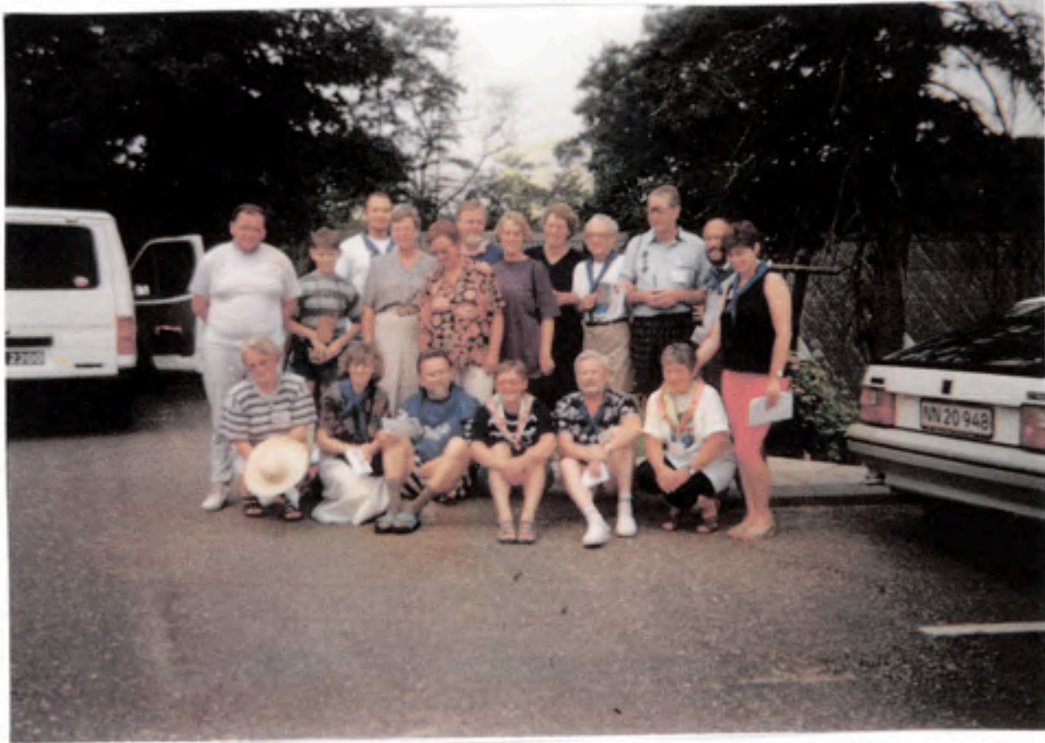
Afsked ved Engedalen