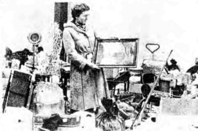
Spejderne har allerede fået mange effekter til loppemarkedet i maj

I forbindelse med markedet opsætter »kludekonerne« en bod, hvor de sælger patch-work og andet håndarbejde. Håndarbejderne udstilles i øvrigt i Sparekassen Hammel et par uger før loppemarkedet.