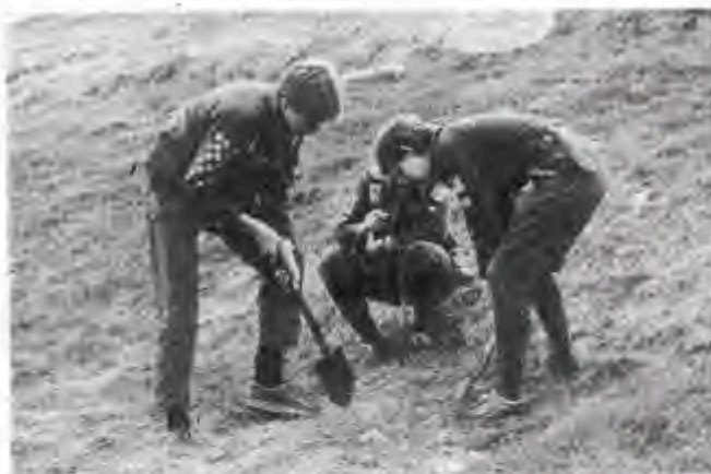
Spejderne plantede 500 træer på mindre end en time

Sct. Georgs Gildet er en sammenslutning af tidligere spejdere og tæller herhjemme 4000 medlemmer.