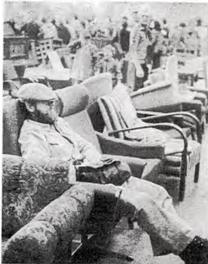
Selvom denne stol var prøvet af andre, før den endte på loppemarkedet i Hammel, er det fornuftigt at teste varen, før den købes. Denne mand blev så glad for sit valg, at han tog sig lur på en halv times tid midt under loppemarkedets auktion.

Hundredevis af arbejdstimer udført af store og små i Sct. Georgs Gildet og de to spejderkorps i Hammel forud for årets loppemarked blev lørdag rigeligt belønnet. Efter optælling af markedets økonomiske resultat viser det sig, at der bliver omkring 50.000 kroner til spejderarbejdet i Hammel.