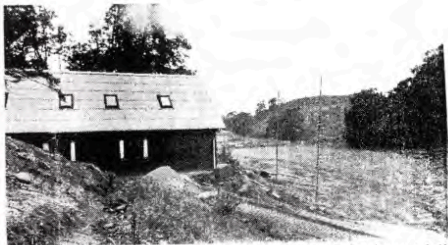
Sådan tager spejdercentret sig ud efter foreløbig tre års planlægning og arbejde.