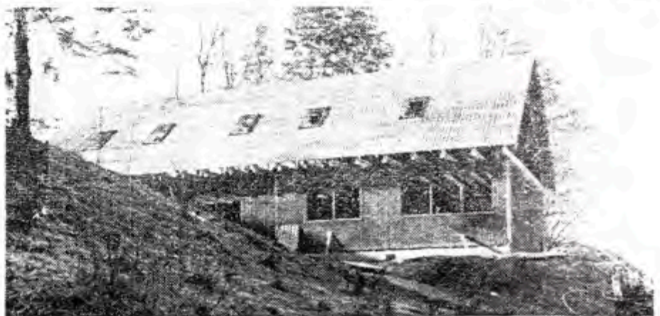
Spejdercentret i Engedalen bliver en måned forsinket.

AARHUS STIFTSTIDENDE, TORSDAG 23. JANUAR 1981 7