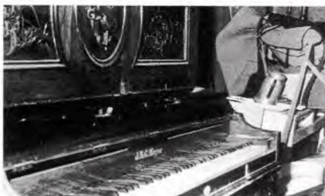
Et klaver med fine træskærerarbejder er også at finde på loppemarkedet blandt tusindvis af andre ting