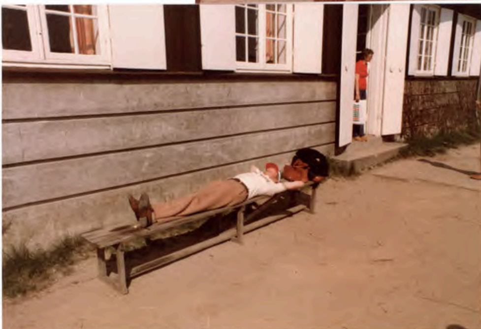
... man kan godt trænge til et lille hvil!