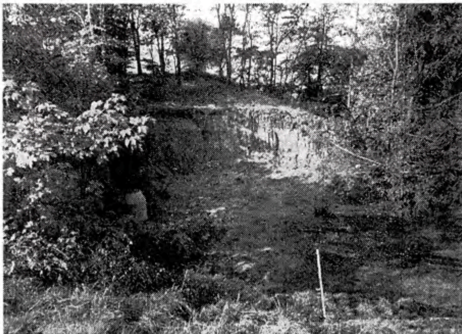
Der er planeret på stedet, hvor skydeselskabet tidligere havde pavillon, og om få dage starter byggeri af første afsnit af spejdercentret. (Foto: Brit).