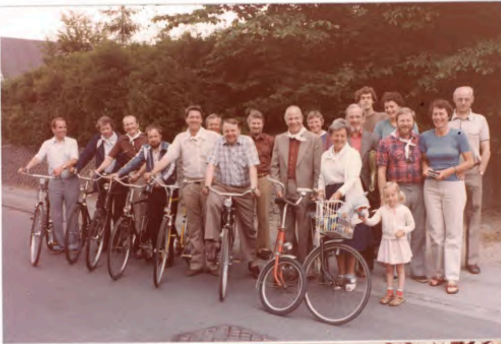
De friske gildebødre gratulerer gildemesteren med de 50 år