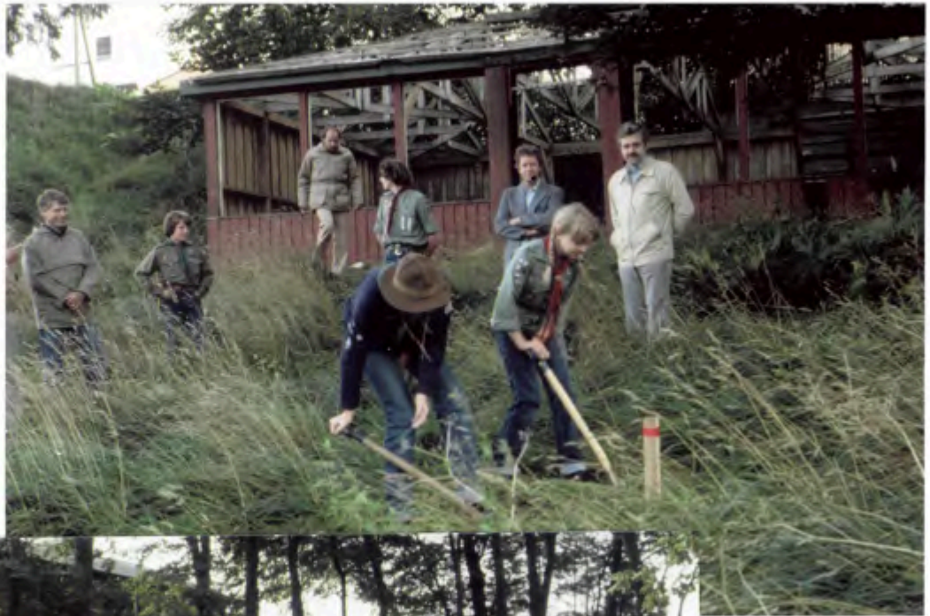
Arbejdsdage på det nye spejdercenter