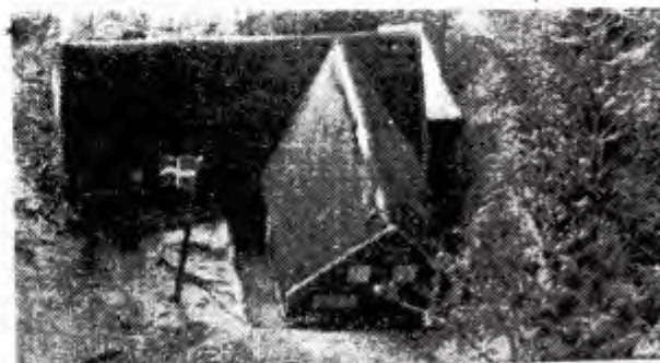
Sådan kommer spejdercentret til at se ud.