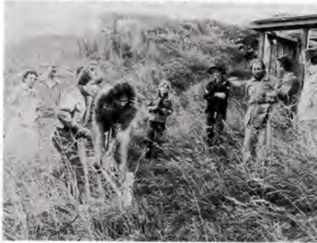
For nogle uger siden blev det første spadestik taget

Venter rejsegilde på første etape i november