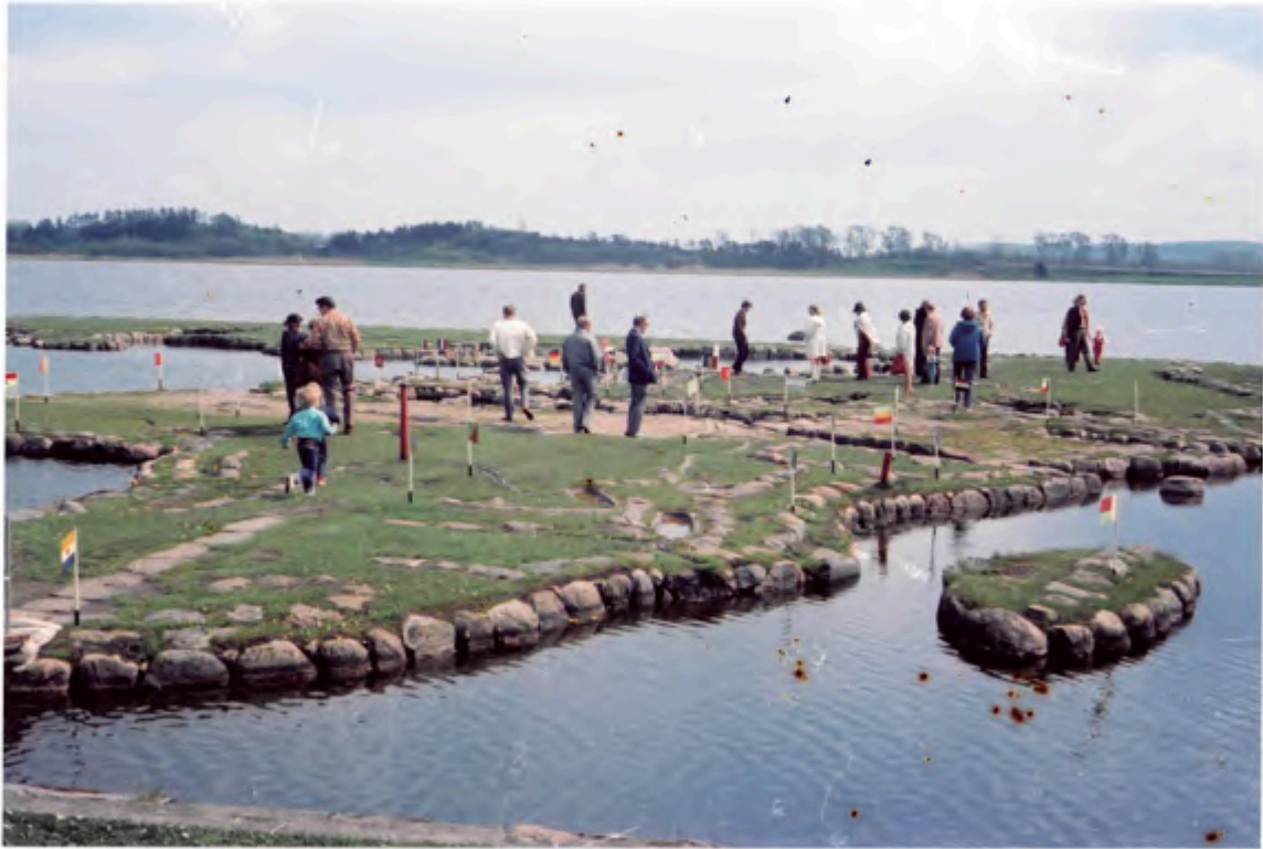
Fra skovturen 11. maj