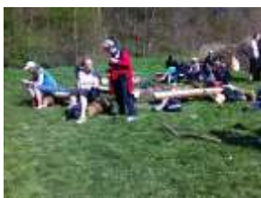
Råhygge ved Bålstedet i Engedalen

Derudover fik alle deltagerne et emblem for deltagelse i Pøt mølle løb 2014.