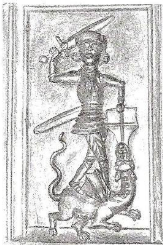
Stolegavl i Helligåndskirken i Faaborg

MEDLEMSBLAD FOR SCT. GEORGS GILDET I HAMMEL